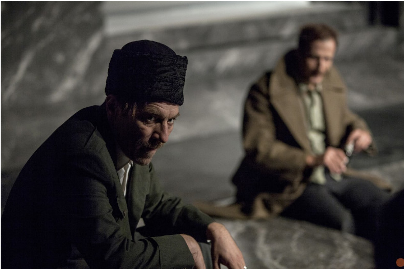
Στους νικητές και ο «Γιούγκερμαν» στο Πορεία με 5 βραβεία

ΔΙΑΒΑΣΤΕ ΠΕΡΙΣΣΟΤΕΡΑ ΠΑΡΑΣΤΑΣΗ | ΘΕΑΤΡΟ | ΒΡΑΒΕΙΑ | ΘΕΑΤΕΣ | ΚΟΙΝΟ