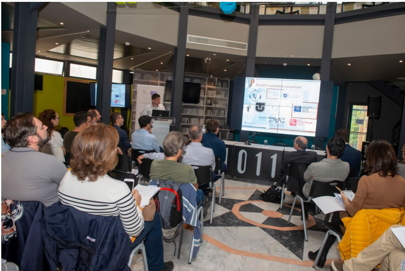
Η πρώτη παρουσίαση της πλατφόρμας για την πολιτιστική κληρονομιά

Τρεις διακεκριμένοι ελληνικοί οργανισμοί, αφοσιωμένοι στην έρευνα, τη διαφύλαξη και την ανάδειξη του Πολιτισμού, σε συνεργασία με 6 ακόμα Ευρωπαίους εταίρους δημιούργησαν σε διάστημα τριών ετών ερευνητικής εργασίας και ανάπτυξης την 1η online Πλατφόρμα Κοινωνικής Δικτύωσης αφιερωμένης στην πολιτιστική κληρονομιά όλης της Ευρώπης, PLUGGY.