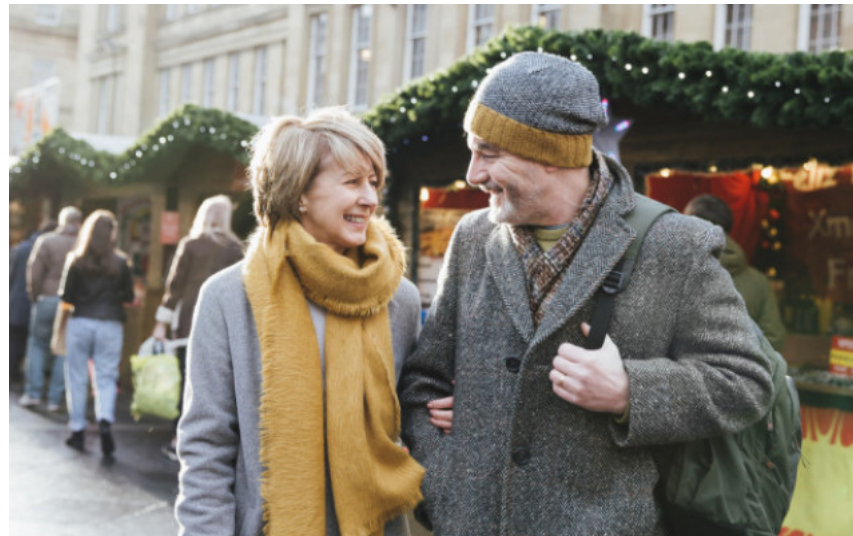
ΜΕ ΑΠΟΦΑΣΗ ΕΦΚΑ

Συνάντηση της ΠΑΕ Ολυμπιακός με τον Λευτέρη Αυγενάκη -Τι ειπώθηκε (/athlitika/synantisi-tis-pae-olympiakos-me-ton-leyteri-aygenaki-ti-eipothike)