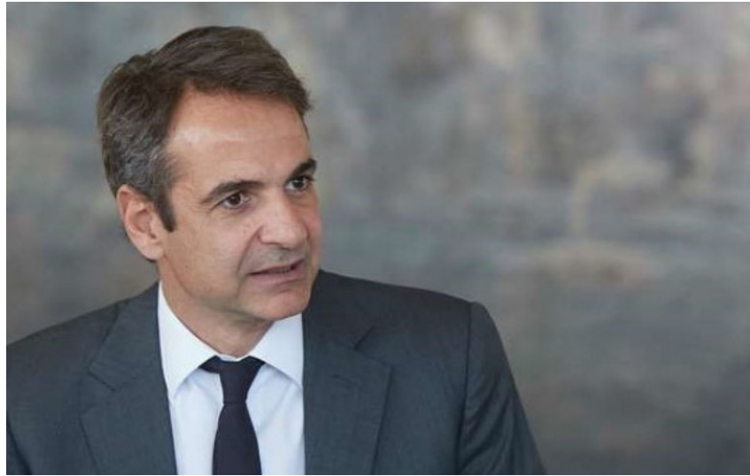
ΤΑ 16 ΒΑΣΙΚΑ ΣΗΜΕΙΑ ΤΟΥ ΠΡΟΓΡΑΜΜΑΤΟΣ

Το όραμά του για μια νέα Ελλάδα παρουσίασε ο Μητσοτάκης (/politiki/orama-toy-gia-mia-nea-ellada-paroysiase-o-mitsotakis)