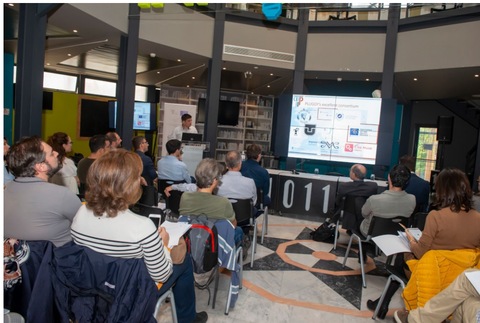
Η πρώτη παρουσίαση της πλατφόρμας για την πολιτιστική κληρονομιά

Η καινοτόμα ψηφιακή πλατφόρμα PLUGGY ( https://www.iefimerida.gr/news/469379/pluggy-i-platforma-roy-anevazeis-kai-proteineis-enan-oraiο-politistiko-proorismo ) και οι τέσσερις συμπληρωματικές εφαρμογές τοποθετούνται στο παζλ του Ευρωπαϊκού Πολιτισμού, επιτρέποντας στους πολίτες να γίνουν οι ίδιοι πρεσβευτές της πολιτιστικής κληρονομιάς του τόπου τους. Με τρόπο εύκολο και προσιτό μπορούν να καταγράψουν τις εμπειρίες και τη γνώση τους για τον τοπικό πολιτισμό, συνεισφέροντας ουσιαστικά στην ανάδειξη της πολιτιστικής κληρονομιάς της Ευρώπης.