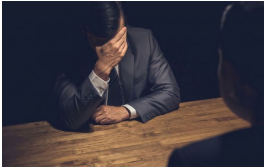
ΕΡΕΥΝΑ ΤΗΣ ΕΛΣΤΑΤ

Το όραμά του για μια νέα Ελλάδα παρουσίασε ο Μητσοτάκης (/politiki/orama-toy-gia-mia-nea-ellada-paroysiase-o-mitsotakis)